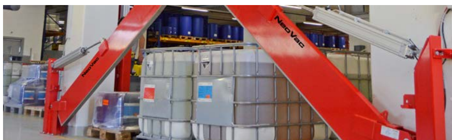
Fix montierte Löschwasserbarriere mit automatischer Entriegelung und Rückstellung