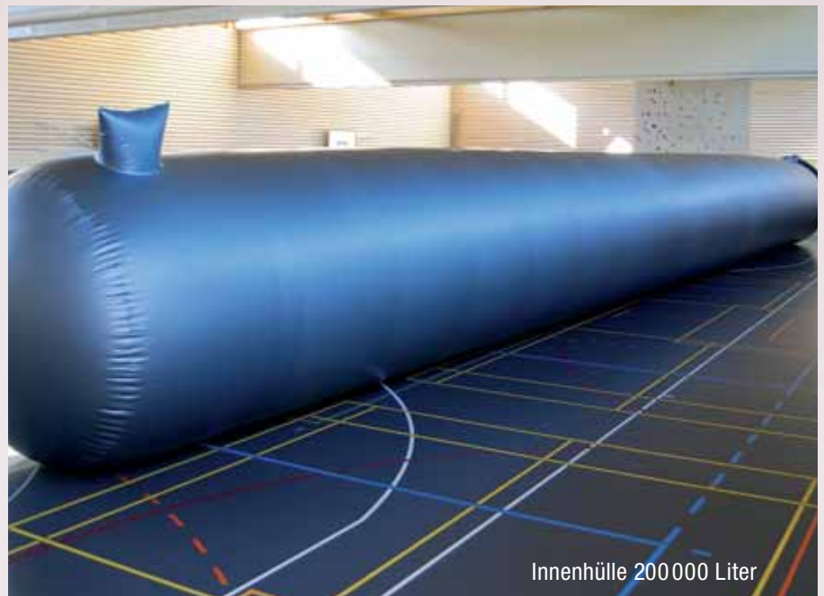
Innenhülle 200 000 Liter

NeoVac verfügt über eine mehr als 35-jährige Erfahrung im sicheren Umgang mit wassergefährdenden Flüssigkeiten. Tankinnenhüllen werden bei uns im Werk auf die exakten Masse des Tanks konfektioniert. Auch für andere Lagermedien als Öl, wie z.B. für verschiedenste Chemikalien, bieten wir Lösungen mit Spezialfolien.