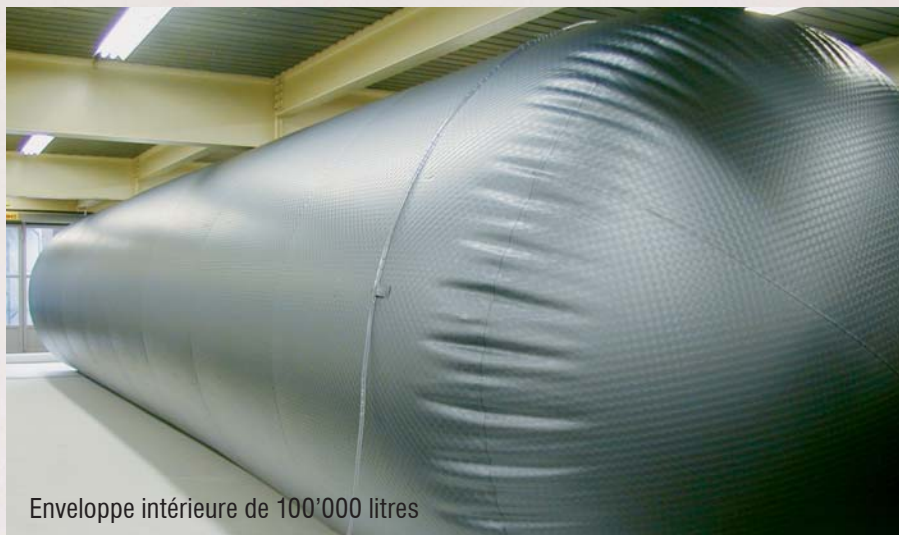
Enveloppe intérieure de 100'000 litres

NeoVac a acquis au cours de ces 35 dernières années un savoir-faire unique pour les questions touchant à la protection des eaux et à l'environnement. Les enveloppes intérieures sont confectionnées sur mesure par nos soins, et peuvent aussi être utilisées pour d'autres produits que l'huile de chauffage, comme par exemple, les produits chimiques. Nous avons toujours la solution à votre problème.