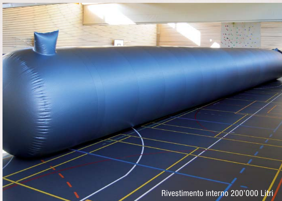
Rivestimento interno 200'000 Litri

NeoVac dispone di oltre 40 anni di esperienza nella gestione sicura dei liquidi inquinanti. In fabbrica le guaine per il rivestimento interno dei serbatoi vengono confezionate in base alle misure precise del serbatoio. Offriamo soluzioni con guaine speciali anche per fluidi di stoccaggio diversi dall'olio, ad esempio per diverse sostanze chimiche.