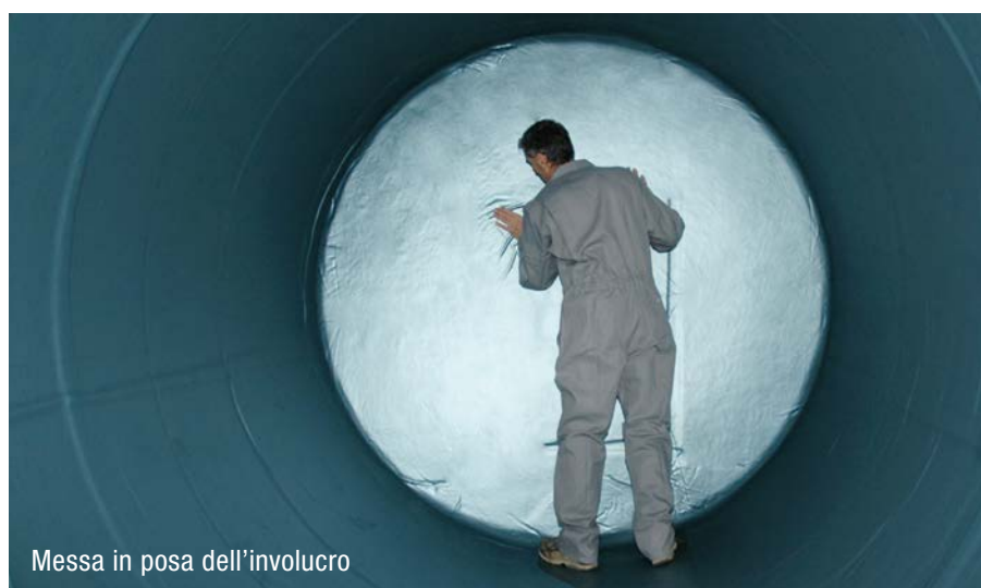
Messa in posa dell'involucro

NeoVac offre una rete di assistenza capillare e garantisce il minimo tempo di intervento in caso di anomalia o per la manutenzione.