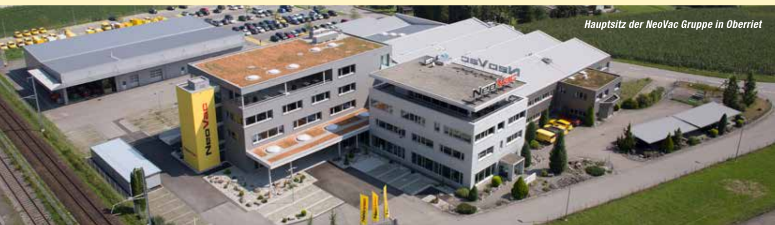
Hauptsitz der NeoVac Gruppe in Oberriet

• 10 Niederlassungen in der Schweiz, Liechtenstein und Österreich