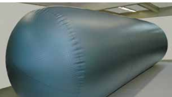
Tankinnenhülle zur Sanierung von Tanks