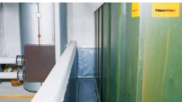
Tankraumfolie für Auffangwannen