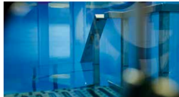
Folienauskleidung für Trinkwasserreservoirs