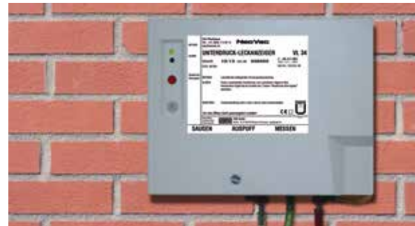
24 Stunden-Service für die ganze Schweiz