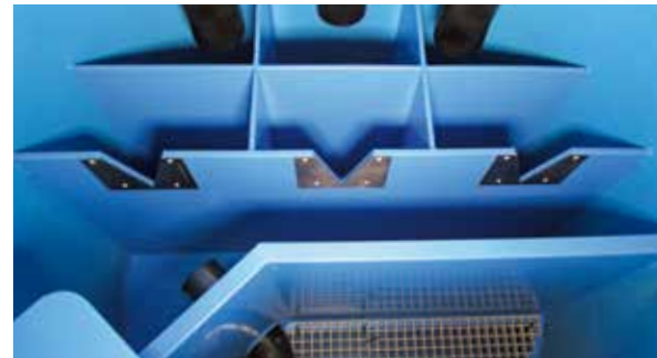
Brunnenstuben und Kleinreservoirs aus PE