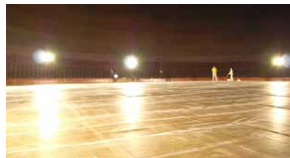
Doppelboden für Stehtanks