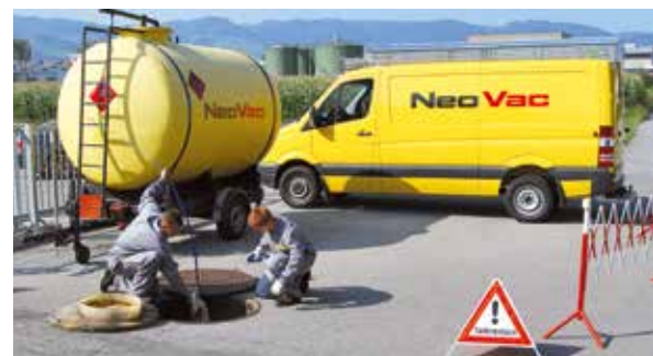
Fachmännische Revision von Öl-, Benzin- und Chemietanks