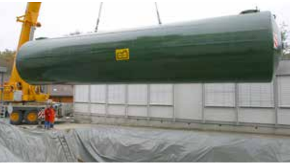
Planung und Bau von Neuanlagen jeder Grösse