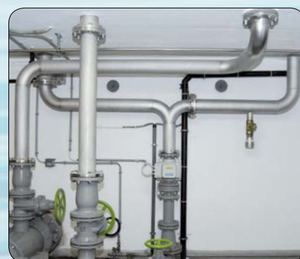
Montage de canalisations en acier chromé par les spécialistes de NeoVac