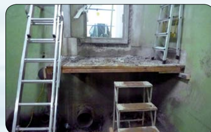
Travaux du maître d'ouvrage