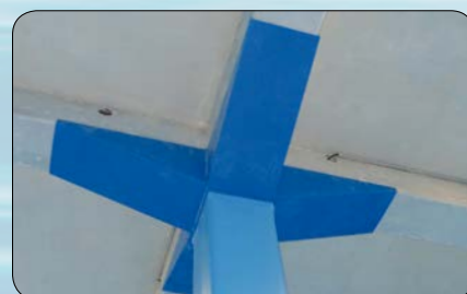
Les colonnes sont habillées d'un caisson en PE