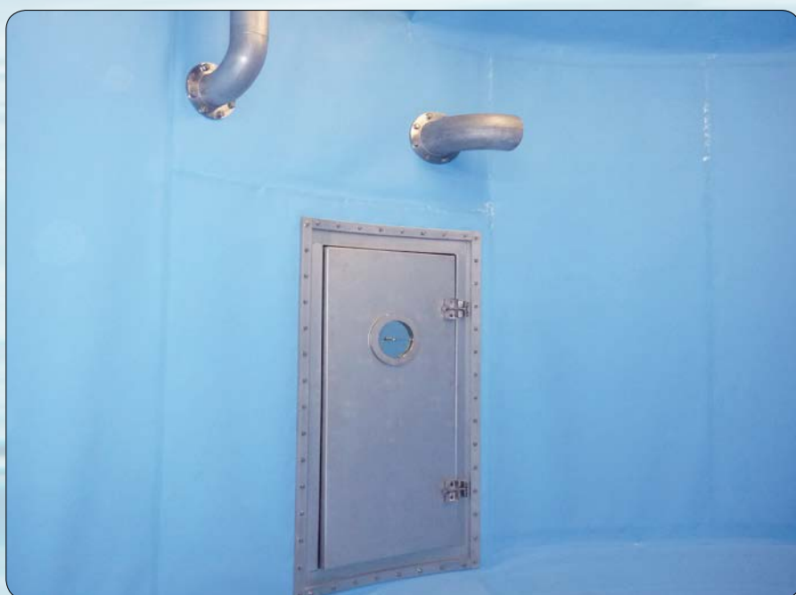
La souplesse du matériau permet son installation irréprochable même dans les zones à problème telles que les arrondis

Notre feuille pour réservoir d'eau potable ne contient aucun solvant, fongicide ou métaux lourds. Sa fabrication, son traitement et son usage sont parfaitement compatibles avec l'environnement. Le film est en outre très facile à entretenir.