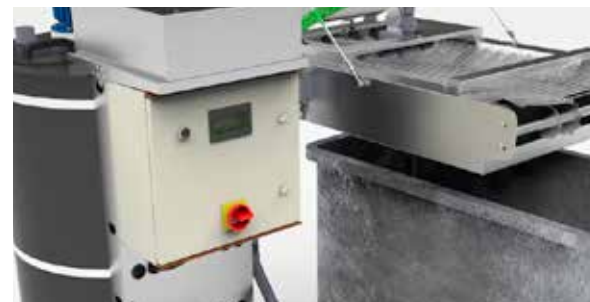
Installation de fractionnement chimique