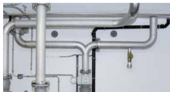
Construction de conduites en acier inoxydable