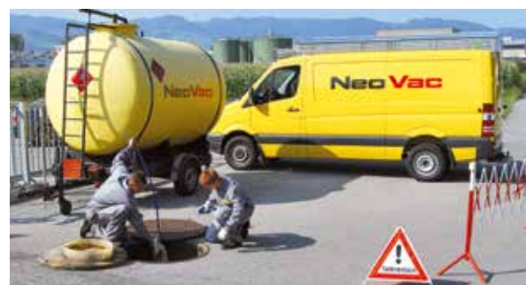
Révisions de citernes mazout, essence et produits chimiques