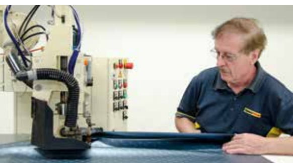
Atelier NeoVac de confection des feuilles synthétiques