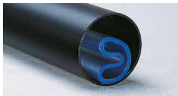
Réhabilitation intérieure de conduites d'eau potable enterrées