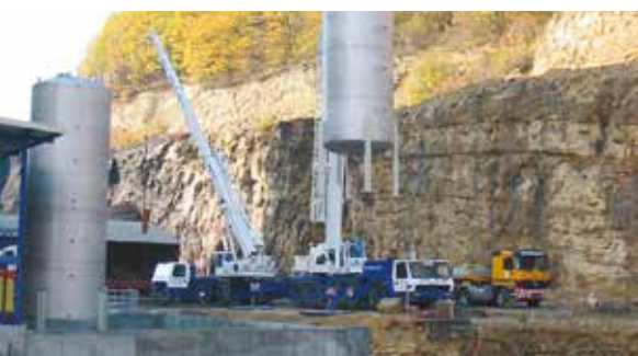
Projet de réservoirs de grande capacité