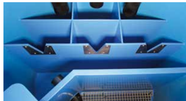
Chambres de captage et petits réservoirs en PE