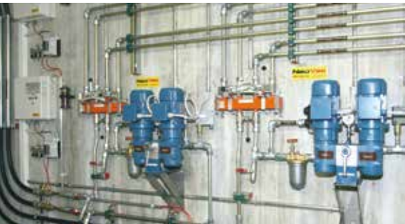
Alimentation en combustible