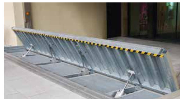
Protection rabattable électropneumatique contre les inondations