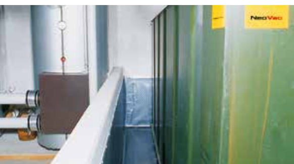
Feuille d'étanchéité préconfectionnée ou en Kit