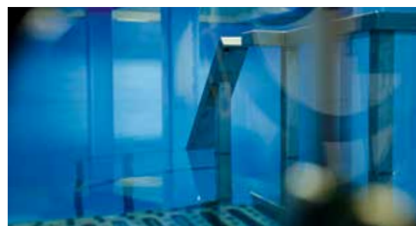
Feuille d'étanchéité synthétique pour réservoir d'eau potable