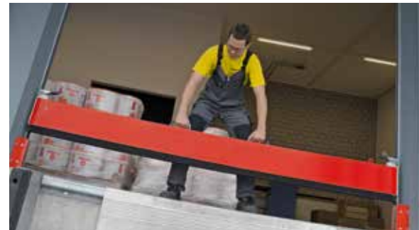
Barrière de retenue d'eau d'extinction d'incendie