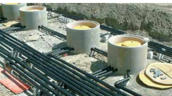
Construction de stations-service