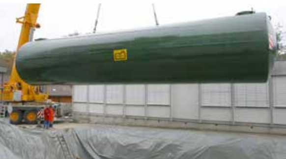
Planification et construction de nouvelles installations