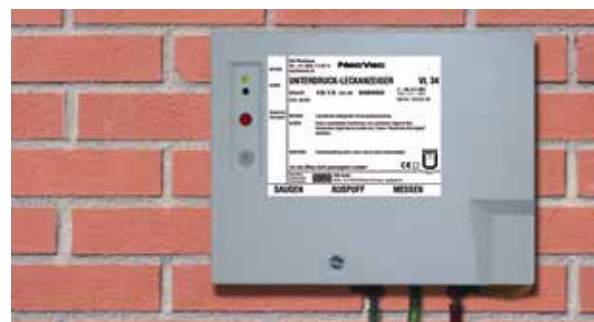
Un service 24h/24 dans toute la Suisse