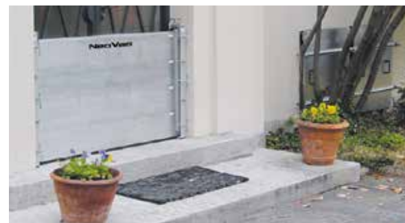
Barrière de protection contre les inondations