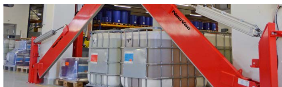
Paratia per acqua antincendio fissa con sblocco e ritorno automatici