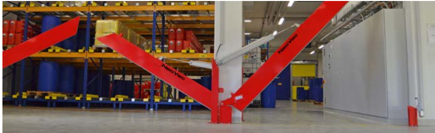
Protezione pneumatica interamente automatica contro le fuoriuscite