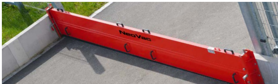
Barriera di contenimento mobile